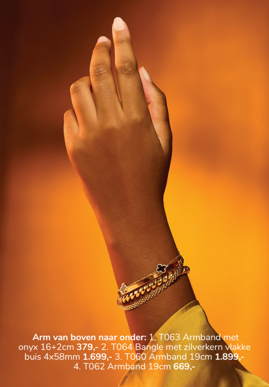
Arm van boven naar onder: 1. T063 Armband met onyx 16+2cm 379,- 2. T064 Bangle met zilverkern vlakke buis 4x58mm 1.699,- 3. T060 Armband 19cm 1.899,- 4. T062 Armband 19cm 669,-

Een grote keuze in gouden ringen, met of zonder diamant. Het is heel trendy om er meerdere aan een vinger te dragen, of aan elke vinger één.